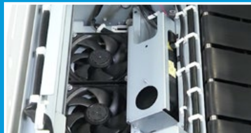
Espectrofotómetro en línea

Xerox ACQS es una potente combinación de un avanzado software de gestión del color y un hardware integrado que liberan al operador de las complejas decisiones de mantenimiento del color para trasladarlas a un sistema automatizado, eliminando así el tiempo y los errores asociados a una gestión manual del color. Una vez iniciado por el operador, ACQS automatiza los gráficos de impresión y medición de la calibración, y calcula ajustes precisos en tablas de color en función de los resultados.