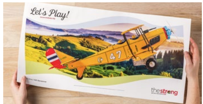
Impresión en formato largo, con un tamaño máximo de papel de 330 x 660 mm

Todo ello se traduce en unos mejores márgenes, unos mayores beneficios y la posibilidad de crecer estratégicamente con una única inversión de futuro.