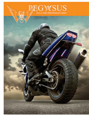
Elija el naranja Impresión con quinto color

Puede cargar rápidamente naranja, verde o azul como complemento de CMYK para ampliar la gama cromática de la prensa y facilitar la reproducción de colores directos y la fidelidad a la marca de sus clientes de impresión.