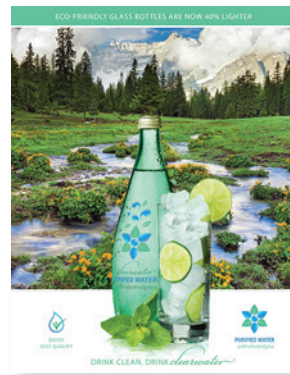
Elija el verde Impresión con CMYK